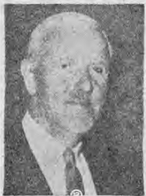
Sir Stanley Rouse, Presidente de la F.I.F.A. estará presente en el Campeonato Norte, Centroamericano y del Caribe a celebrarse en El Salvador.

SANTIAGO, 31. (Exclusivo para LA REPUBLICA)— Hoy he tenido la ocasión de saludar en las amplias tribunas de prensa del Estadio Nacional de Santiago a destacados miembros de la Confederación Norte-Centroamericana y del Caribe de Fútbol incluso al delegado de nuestra zona en el directorio de la F.I.F.A. El primero en saludarme fue Hiram Sosa, el laborioso dirigente guatemalteco que me dio varias noticias muy interesantes de las últimas sesiones del Congreso de la F.I.F.A. Entre ellos que no se otorgó la sede para el siguiente mundial, después del de Londres o sea el de 1970. La lucha está establecida entre México y la Argentina que pelean a brazo partido por la sede.