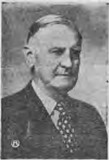
General Robert E. Wood

Cada actividad humana significa una lucha. En esa lucha se triunfa o se sufre la derrota. Hay casos en que se pueden atender varias actividades con éxito atribuyéndose así un cúmulo de victorias que harían palidecer de envidia a grandes hombres de todas las épocas.