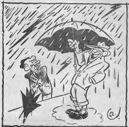
—Claro, has te carcajós porque estás "fresco"...! —Y más que voy a estar... fíjate que tengo que ir al caite hasta Guadalupe porque no tengo ni los veinte pa' comión...